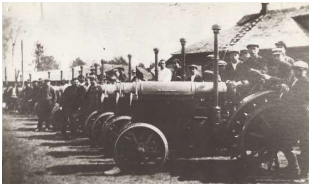
Тракторный парк Максатихинской МТС перед весенним севом. 1934 год.

В 1931 году была создана Максатихинская МТС. Машинно-тракторная станция (МТС) государственное сельскохозяйственное предприятие в СССР и ряде других социалистических государств, обеспечивавшее техническую и организационную помощь сельскохозяйственной техникой крупным производителям сельскохозяйственной продукции (колхозам, совхозам, сельскохозяйственным кооперативам). Сыграли значительную роль в организации колхозов и создании их материально-технической базы. МТС осуществляли обслуживание и ремонт тракторов, комбайнов и другой сельскохозяйственной техники и давали её в аренду колхозам.