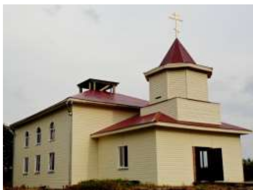
Церковь Рождества Христова. 2018 г.

Церковь Рождества Христова. Церковь деревянная, построена в 1906 году. Имела два престола: Преображенский и Скорбящей Божьей Матери. Церковь стояла на цоколе из валунов в северо-западной части села, обшита тесом.