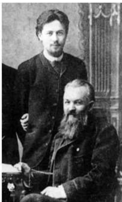
А.П. Чехов и А.С. Суворин.

125 лет назад в Максатиху приезжал А. П. Чехов (1896 г.)