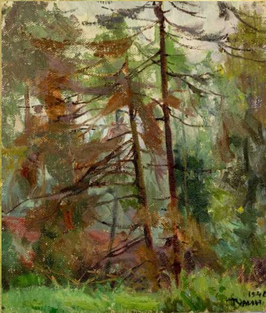
«Этюд с елями», 1940 год, 27 х 22 см., частное собрание.