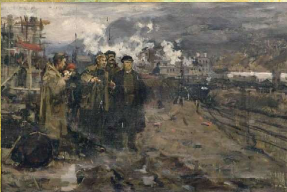
«Киров в Хибинах», 1950 год, холст, масло 49,5 x 73 см., Брянский областной художественный музей.