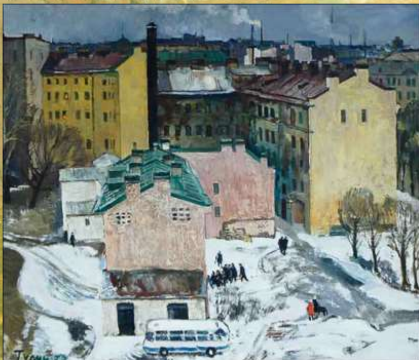
«Наш двор», 1970 год, холст, масло, Ивановский областной художественный музей.

В Петрограде глава семьи быстро нашел работу по специальности, а мама Юрия стала домохозяйкой, занимаясь домашней работой и воспитанием сына, который через несколько лет стал считать этот город, к тому времени уже переименованный в Ленинград, своей настоящей родиной. Здесь, когда подошло время, он пошёл в школу. Здесь у него проявился и интерес к рисованию.