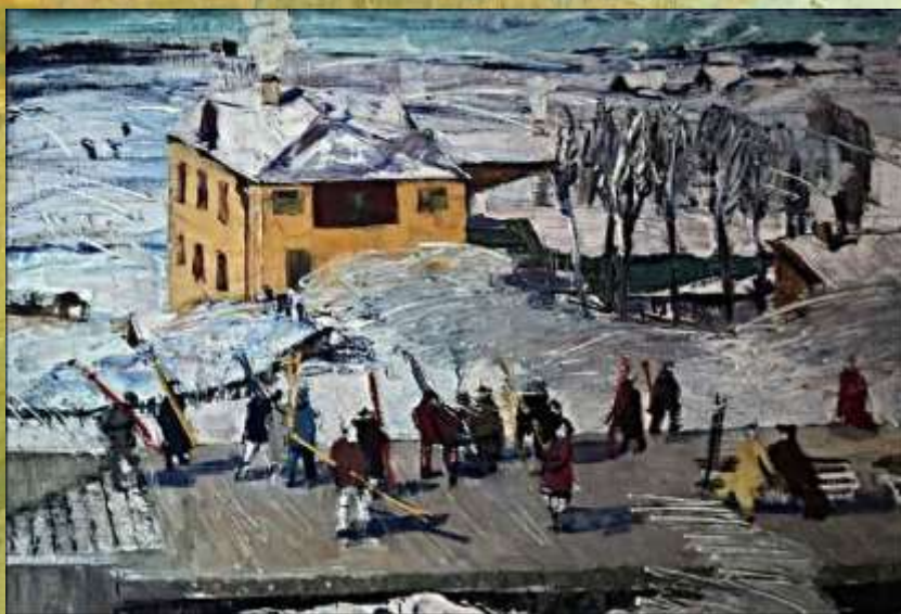
«Ленинград. Станция Ланская», 1958 год, холст, масло, Воркутинский краеведческий музей.

1950-е годы в творчестве Юрия Тулина характеризуются тем, что художник часто обращался к ленинградским пейзажам, некоторые из которых из натуральных этюдов впоследствии становились законченными самостоятельными картинами. Именно так произошло с его этюдной работой «Станция Ланская», написанной мастером в 1957 году, которая спустя год превратилась в двухметровое полотно «Ленинград. Станция Ланская» (1958), впоследствии переехавшее в Воркутинский краеведческий музей.