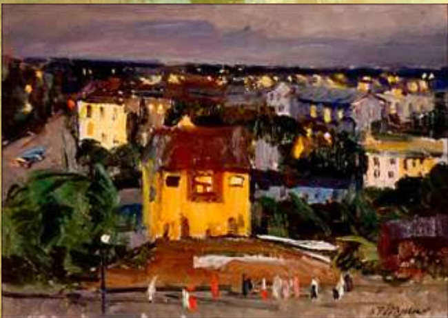
«Станция Ланская», 1957 год, холст, масло, частное собрание.