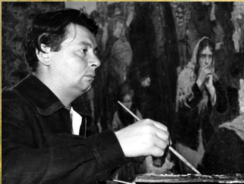
Юрий Тулин в работе над картиной «Лена», 1956 год.

В 1961 году Юрий Тулин был удостоен почетного звания «Заслуженный художник РСФСР», в 1965-м — звания «Заслуженный деятель искусств РСФСР». Персональные выставки произведений Юрия Ниловича Тулина были показаны в Ленинграде (1972, 1986, 1987), Москве (1972), Санкт-Петербурге (2001).