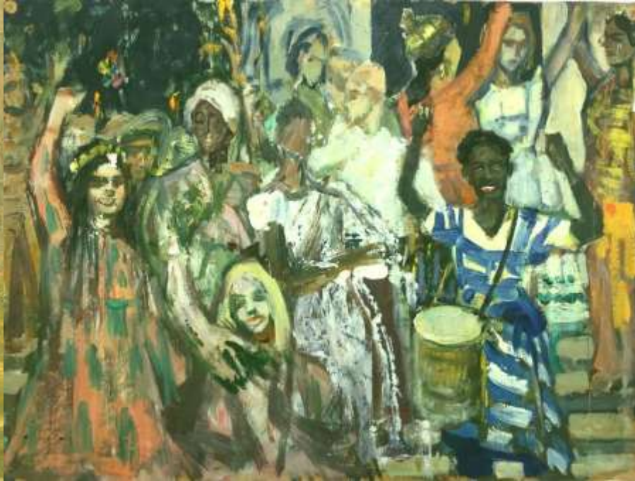
«Фестиваль молодежи», 1958 год, холст, масло, частное собрание.