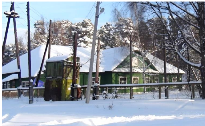
Здание типографии, ул. им Братьев Даниловых, д.15