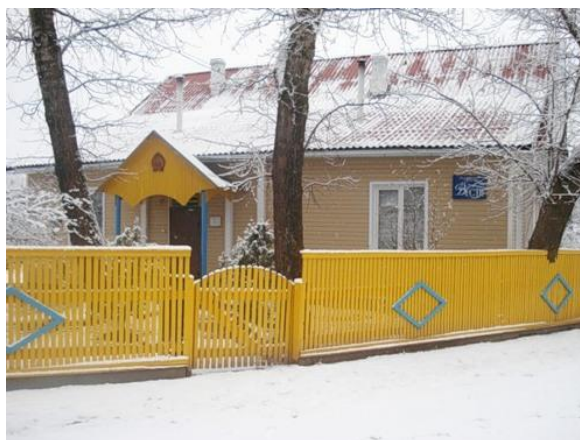
Здание редакции, ул. им Братьев Даниловых