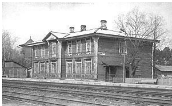
Ж/д вокзал п. Максатиха

В Максатихе в 1909 г. жил Н.С. Гумилев. В книге В. Лукницкой «Любовник. Рыцарь. Летописец» приводится хронология жизни Гумилева с указанием источников, из которых почерпнута информация: