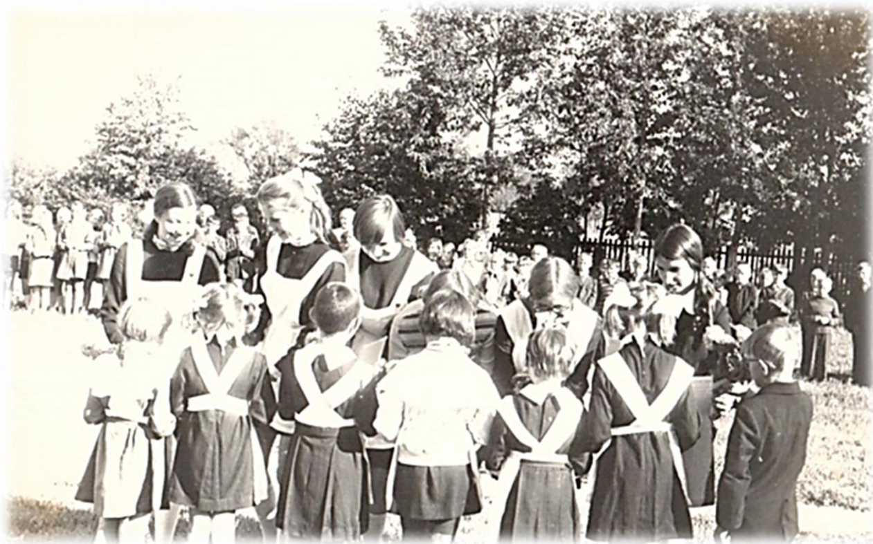
1 сентября 1974 г. в Пятницкой школе. Приветствие первоклассников.