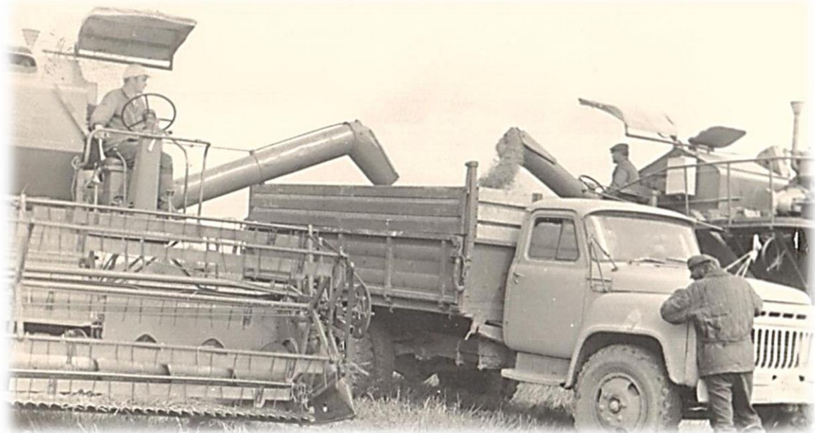
Уборка зерновых комбайнами