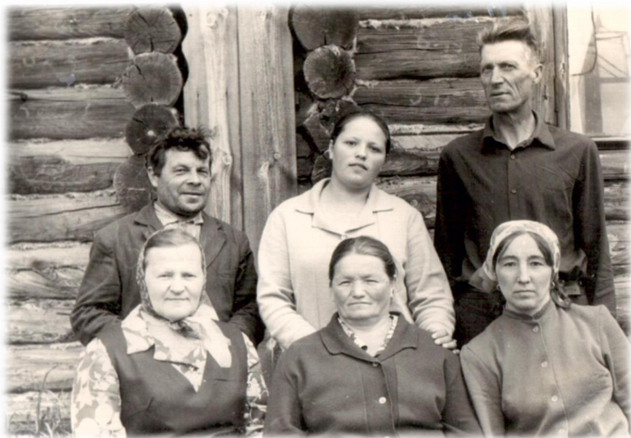
Работники почтового отделения.