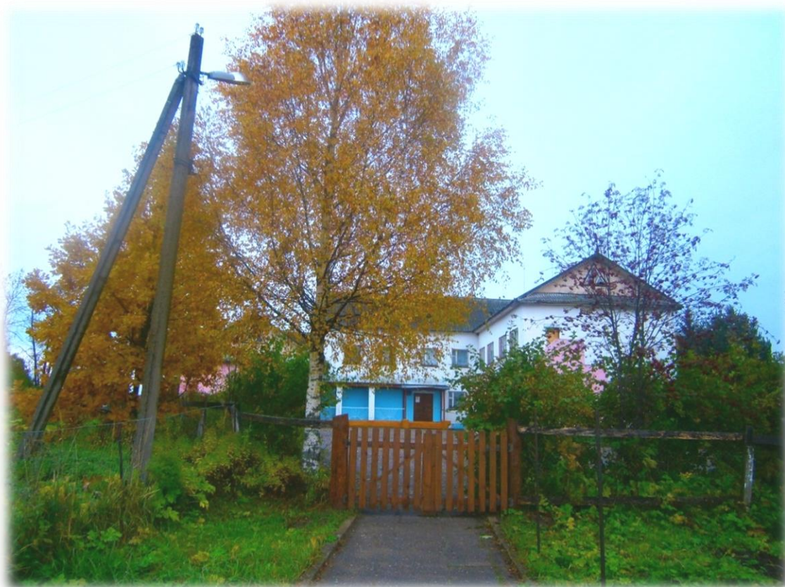
На данный момент школа находится в п. Труженик, но по-прежнему называется «Пятницкая»

В школе было печное отопление и каждый ученик должен был заготовить 2 кубометра дров (распилить, расколоть, сложить). Родители приходили и помогали своим детям.