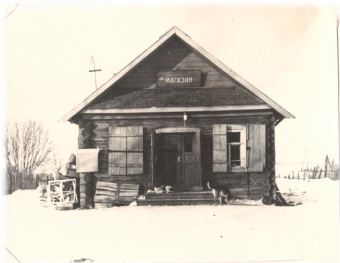
Магазин в д. Пятницкое в 1973 году