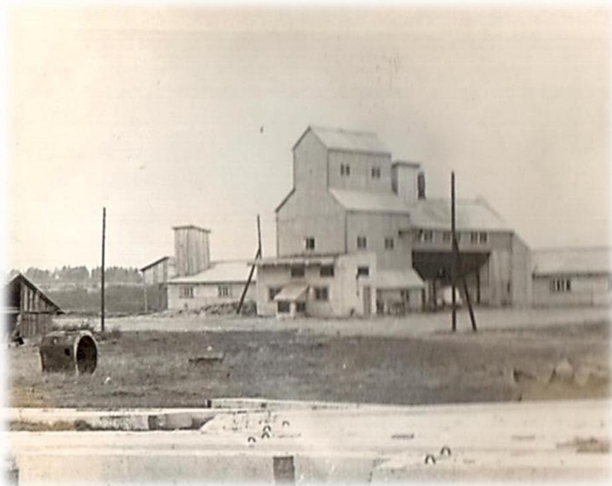
Новая могучая сушиллка на северной стороне деревни.