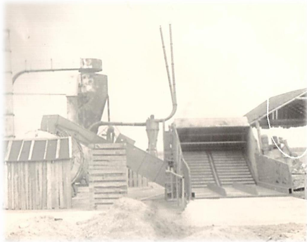
Агрегат для приготовления травяной муки

Зерновое - Калинин Н.Н. первое отделение д. Пятницкое.