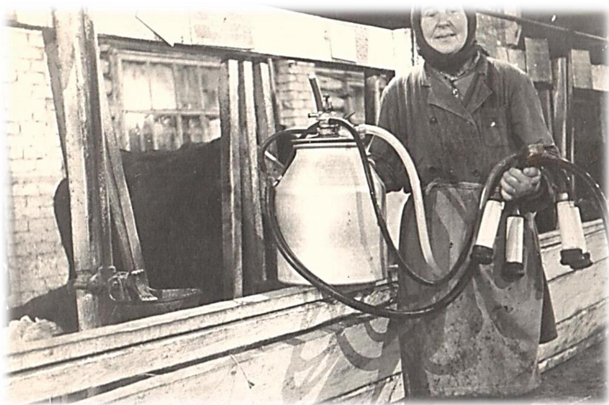
Молочный цех первого отделения совхоза «Труженик» (Пятницкая ферма)

В деревне Пятницкое располагалась молочная ферма. А в центральном отделе (п.Труженик) развивалось птицеводство.