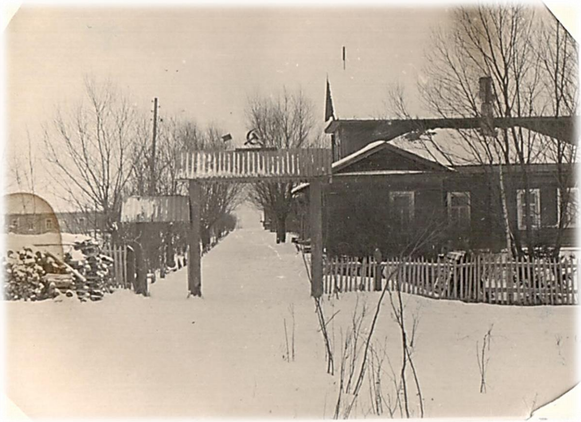
Парадный вход в школу.