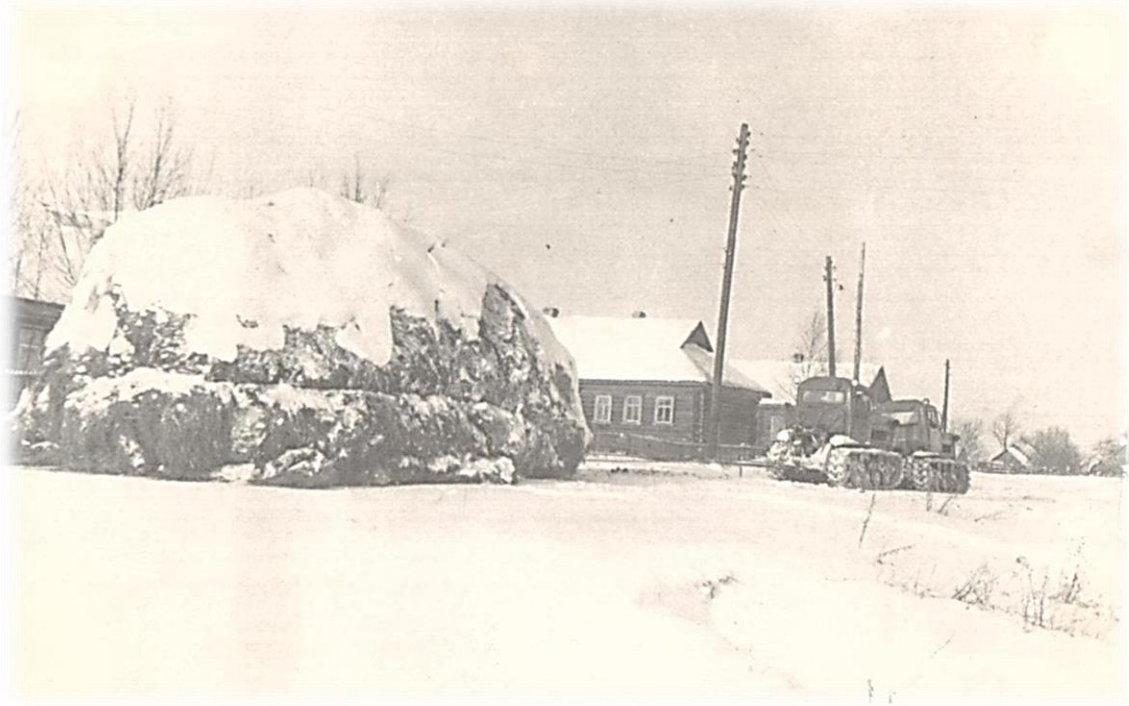
Так доставлялся корм ( в стогах) с поля на ферму. Впереди тракторист Василий Грязнухин