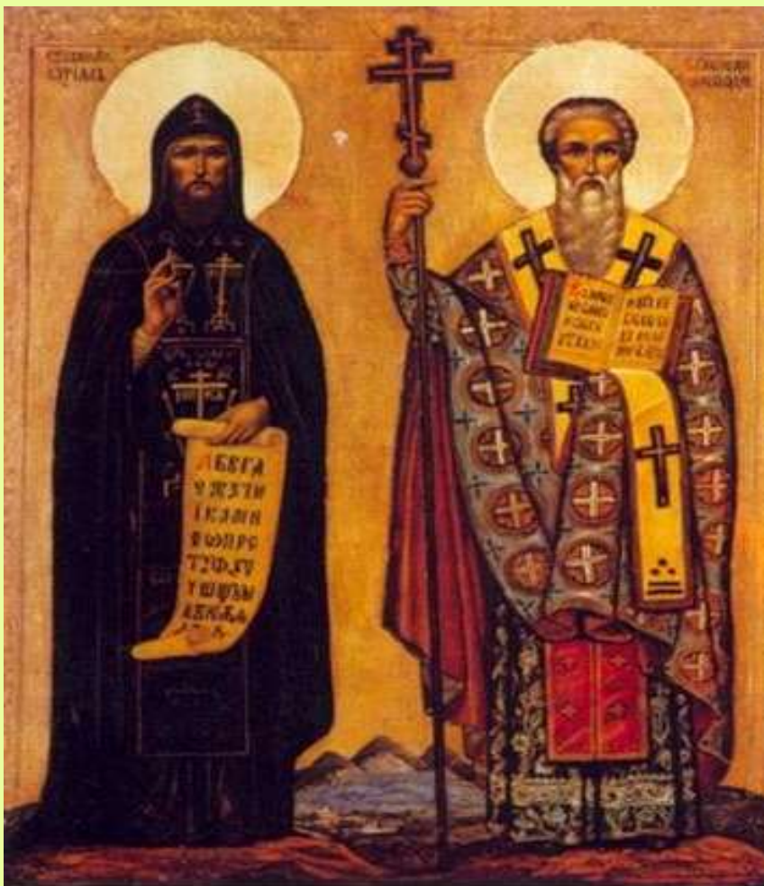
Кирилл и Мефодий

Кирилл и Мефодий – славянские первоучители, великие проповедники христианства, создатели славянской азбуки, первые переводчики богослужебных книг с греческого на славянский язык.