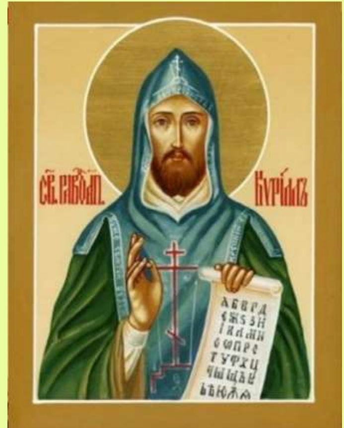
Кирилл (Константин) (827 – 14.02 869)