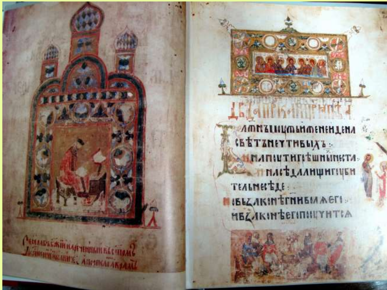
Киевская псалтирь 1397 г. написана литургическим уставом

С принятием христианства в 988 году на Русь пришла славянская азбука. В Киеве, Новгороде и других городах стали создаваться школы для обучения славянской грамотности. Первые книги на «кириллице» написаны уставом.