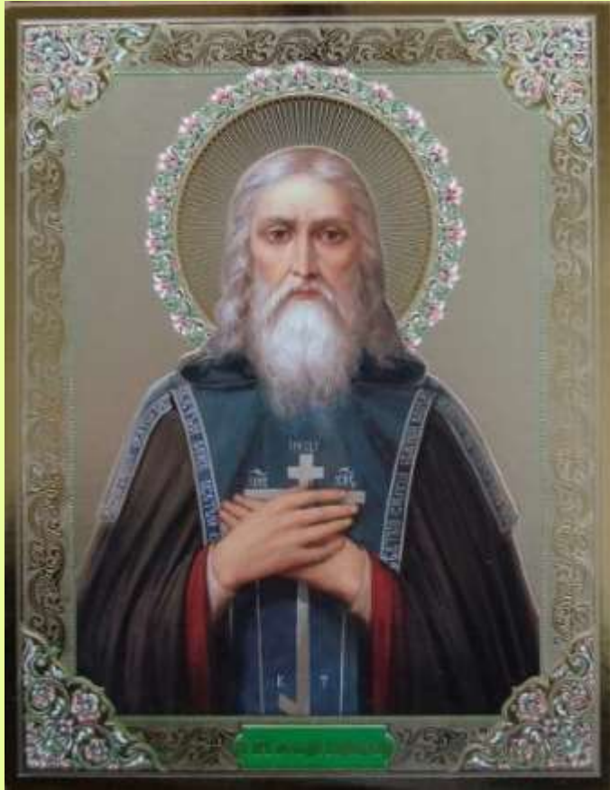
Мефодий (Михаил) (815 – 06. 04. 885)

Кирилл (до принятия монашества в 869 – Константин) и его старший брат Мефодий (Михаил) происходили из византийского города Фессалоники (славянское «Солунь»). Мать мальчиков была гречанкой, а отец болгарин, поэтому с детства у них было два родных языка греческий и славянский. В семье было семь сыновей, причём Михаил ( Мефодий ) – старший, а Константин ( Кирилл ) – младший из них.