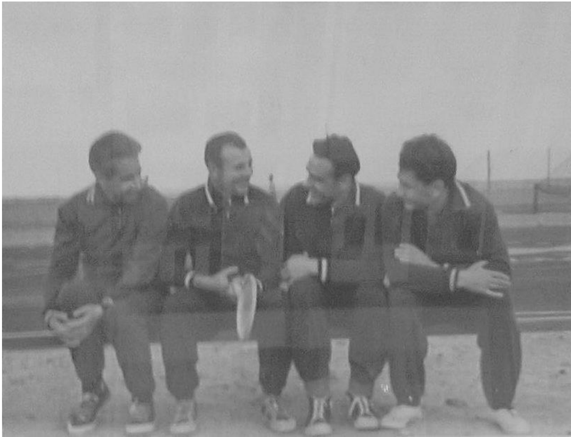
Космонавты: Гагарин, Комаров, Феоктистов, Егоров на спортивной площадке.

Во главе МАИ Образцов оставался до 1972 года.