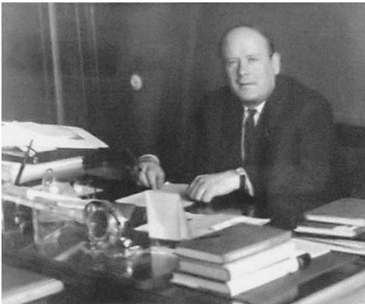
Академик И. Ф. Образцов в рабочем кабинете ректора МАИ.

В годы ректорства Образцов впервые выдвинул задачу превращения МАИ в технический университет, сделал первые значительные шаги в этом направлении.