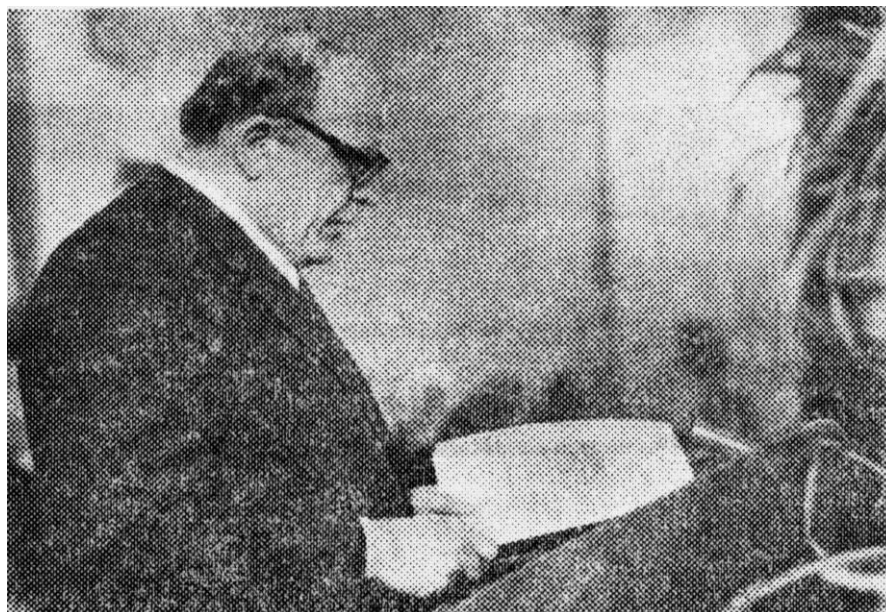
Министр высшего и среднего специального образования РСФСР И. Ф. Образцов вручает награду Максатихинской средней школе.

В 1977 году Максатихинская средняя школа торжественно отметила 60-летие. Она была награждена медалью Министерства высшего и среднего специального образования РСФСР. Награду вручил И. Ф. Образцов.