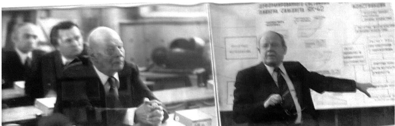
Академик И. Ф. Образцов докладывает президенту АН СССР академику Александрову А. П. о результатах расчёта и испытании самолета ЯК – 42.

Во главе МАИ Образцов оставался до 1972 года.