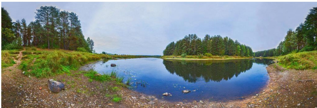
Местечко «Светлый ручей» река Молога.

Он нежно любил свою «малую родину», и пронес эту любовь через всю жизнь. На стене его кабинета всегда висела большая цветная фотография Светлого ручья одного из красивейших мест на реке Мологе.