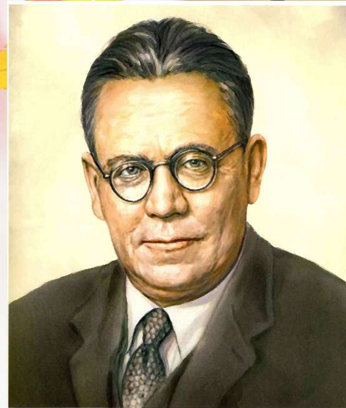
САМУИЛ ЯКОВЛЕВИЧ МАРШАК

И роща бедная, умильно дорожа Цветными листьями на тонких черных прутьях, Не ропщет, не шумит и слушает, дрожа, Разгул ветров на перепутьях.